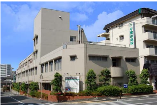
周囲は閑静な住宅地