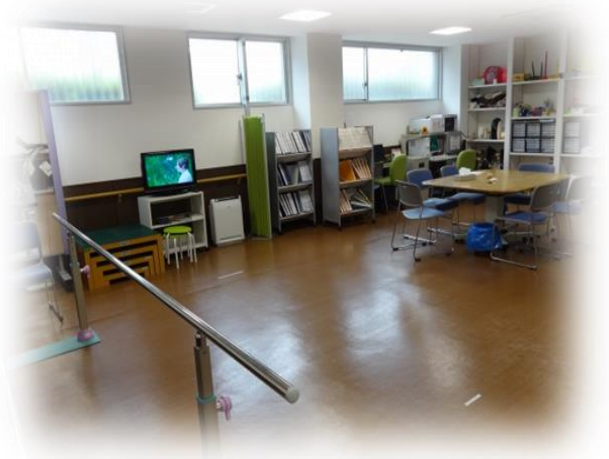
リハビリテーション室の風景