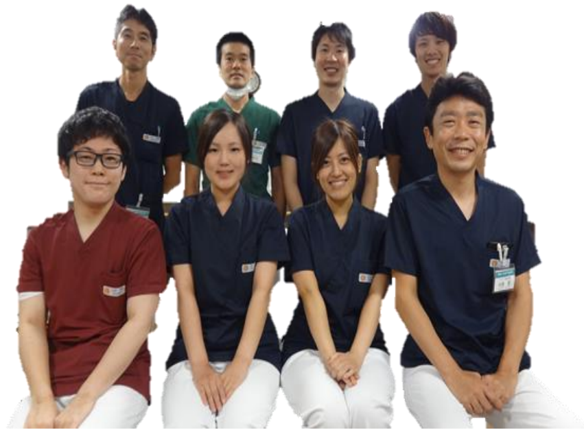
アットホームな雰囲気